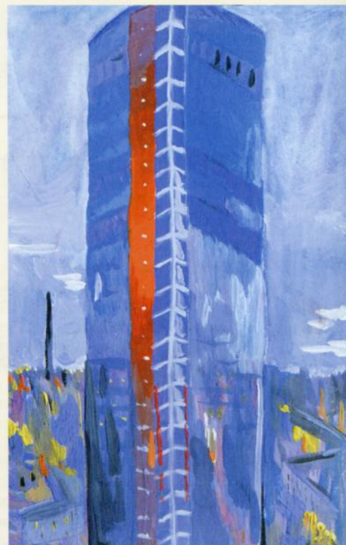
Елена, Россия. «Огни Екатеринбурга»

И дея с зарисовками так понравилась и участникам мероприятия, и сотрудникам, что мы продолжили рисовать, но уже с более взрослой аудиторией. Проект «Мой город. Зарисовки» объединил школьников из Екатеринбурга и Сан-Хосе (штат Калифорния), которые рисовали свой город. Для кого-то родной город – это самые известные памятники и храмы, для кого-то – скамейка возле подъезда или школьный двор. Любые ребячьи идеи на тему