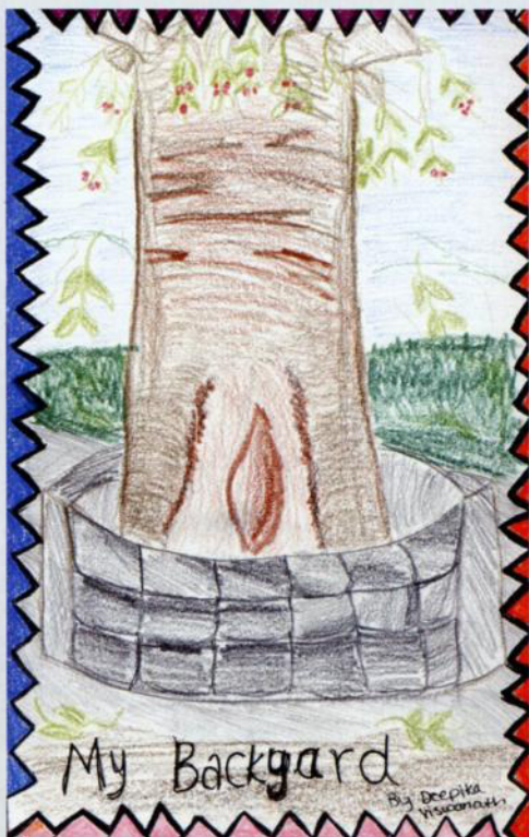
Дипика, Сан-Хосе. «Мой двор»

Мы пригласили в библиотеку ребят младшего возраста (5–11 лет) и предложили каждому создать рисунок на тему «Герои и злодеи». Тема благодатная, в неё красиво вписываются и Колобок, и Емеля наряду с Человеком-пауком и Черепашками-ниндзя.