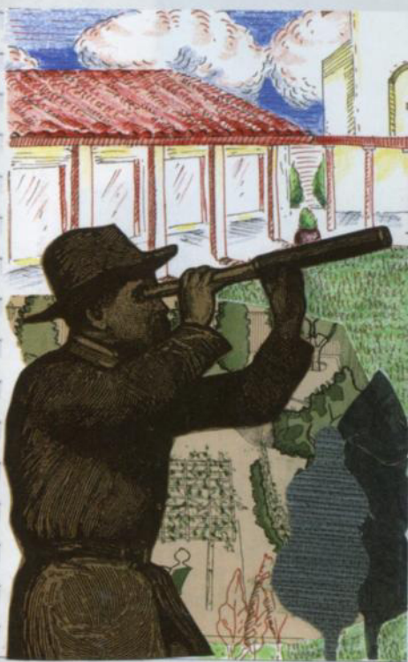
Софи, Сан-Хосе «Прошлое и настоящее»

В-третьих, мы поверили в себя. В то, что наши идеи могут шагать в ногу с современными технологиями, могут удивлять, поражать и радовать. Могут соединять, ни много ни мало, города, страны и континенты!