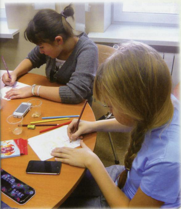
«Герои и злодеи». За работой

Какие проблемы осложняют жизнь современного библиотекаря? Уверена, каждый «практикующий» коллега ответит так: неуклонное снижение количества юных читателей и необходимость соответствовать новым требованиям времени. Не секрет, что сегодня на Западе необычайно популярны так называемые скетчбуки (англ. scetch – набросок, зарисовка; book – книга) – книги для зарисовок. Все, кто любит рисовать, даже не являясь профессионалом, носит с собой такую книжечку для зарисовок. Американцы и европейцы рисуют, когда их посещает вдохновение, есть свободная минутка или просит душа. Рисуют карандашами, ручками, мелками, акварелью. Да-да – приходится носить с собой баночку с водой. Вдруг вдохновение посетит в кафе или в метро? Существуют целые сообщества таких художников. Они ведут свои блоги, странички в ЖЖ, Twitter, Facebook. Именно это и вдохновило Международный отдел Библиотеки главы г. Екатеринбурга на рождение нового большого проекта «Творим вместе». Международный отдел нашей библиотеки включает Американский центр, Австрийскую библиотеку, Кабинет венгерского языка.